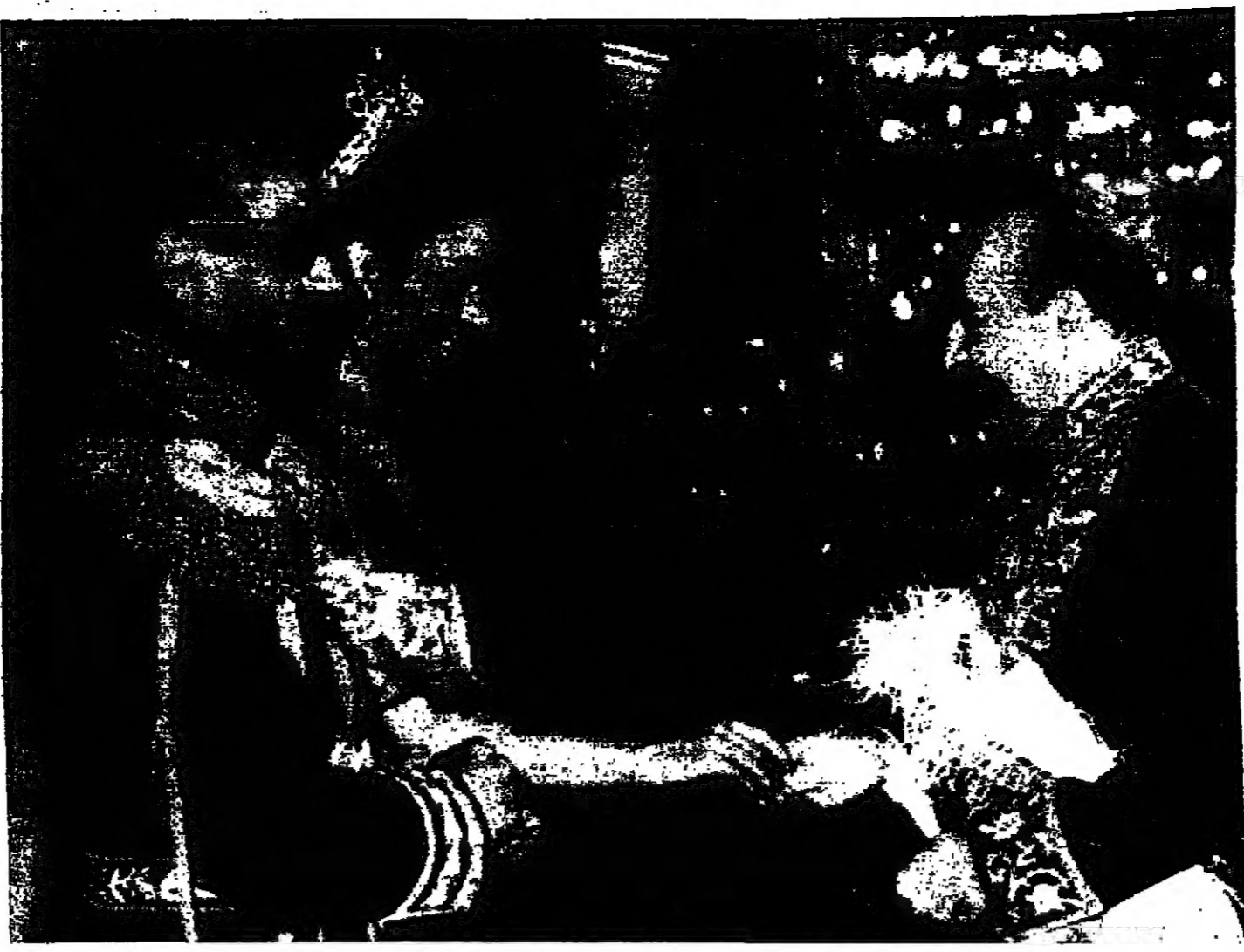
الامبراطورة فرج تقدم قلعة عملة ذهبية الى السيد امير عباس هويدار رئيس وزراء ايران خلال الاحتفال بدمشق والى جنبها جلالة الشاه